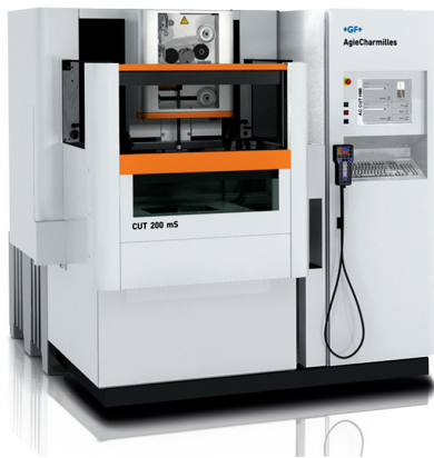
CUT 200 mS切割机床

瑞士阿奇夏米尔公司最新推出的新一代高精度慢走丝线切割机床 CUT 200 mS,标配整体热恒定系统,令您无需高成本投资加工车间也能获得稳定可靠的高精密加工。最新一代的 AC CUT 操作系统,集成了瑞士 GF 阿奇夏米尔公司 60 年的放电