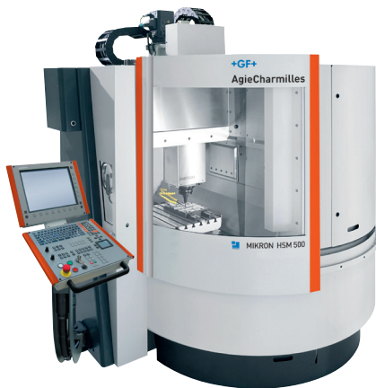
MIKRON HSM 500加工中心

MIKRON HSM 500是为精密模具用户和小型精密零件加工行业量身定制的高速铣削机床。它不但拥有高精度、高动态性能和高切削速度,还拥有出色的排屑功能以及极高的灵活性、操作舒适性和自动化加工能力,非常适合小型汽车模具的加工。