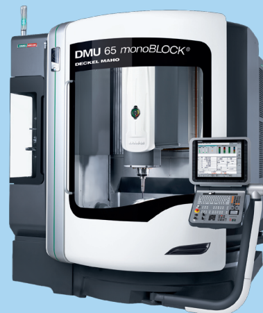
DMU 65 monoBLOCK加工中心

在 DMG/MORI SEIKI 的展台上,5 轴加工中心 DMU 65 monoBLOCK 和车铣复合加工中心 NTX1000 将带领略一次装夹全套加工的高效加工体验,更重要的是 DMU 65 monoBLOCK 还可以选配激光加工选项,从而集 5 轴加工与激光表面纹理加工于一台机床上,大大解决了占地面积,提高了加工效率。带直线电机的高精密高速加工中心 HSC 75 H linear 将为您展示突破传统的模具高速加工方案。立式